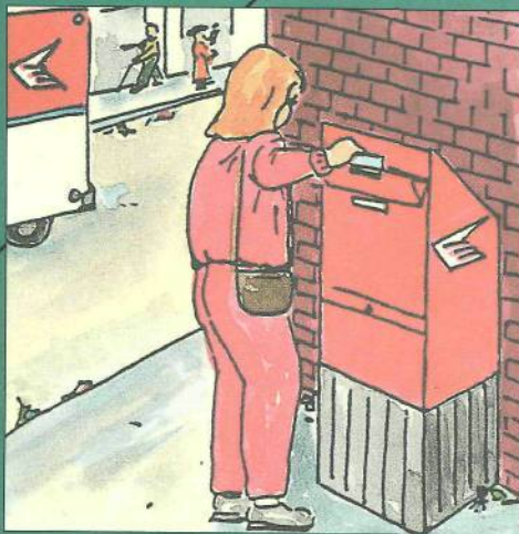
5. Le bureau de poste