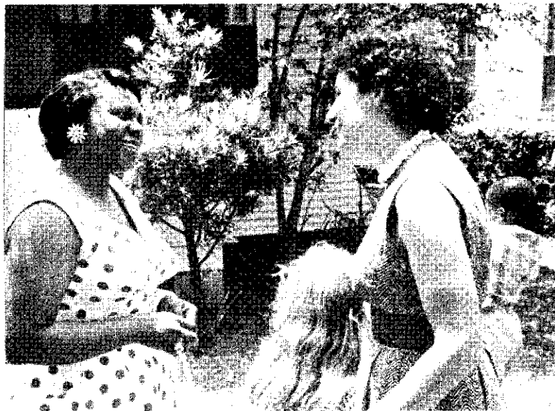
La compréhension internationale