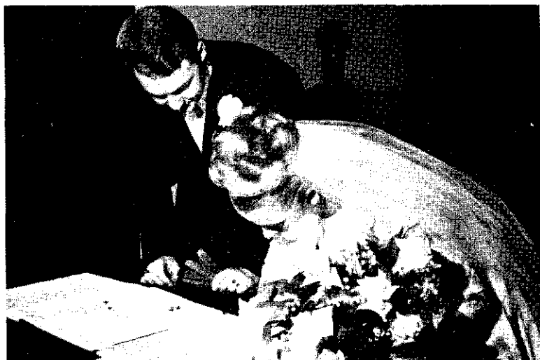
(Fêtes et Saisons)