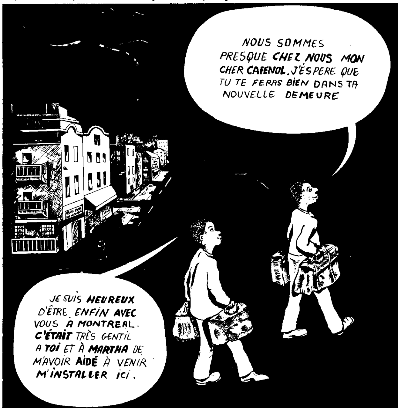
Illustration: P. Filsaimé. Cafénol. Tranches de vie d'un nouveau venu à Montréal. Montréal, Grafik Universel: Éditions, 1982, p.7.

ale nan yon Gwo Rasanbleman nan vil Kebèk. Pi fò granmoun ki te la, se te Kebekwa ak ayisyen, gason kou fanm, ki pa konn li. Nou pa te pè pale sou pwoblèm nou. Anita, ou menm tou, fòk ou leve pye ou pou ou aprann kichòy. Li pa janm twò ta.