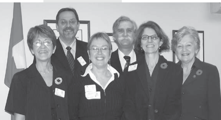
Une délégation de la FCAF a rencontré l'honorable Maria Chaput, sénatrice, Manitoba (à droite sur la photo), lors de la Journée d'action pour l'alphabétisation, le 9 novembre 2007.

La Fédération s'est associée au Movement for Canadian Literacy et à d'autres organismes d'alphabétisation pour sensibiliser les partis politiques représentés à la Chambre des communes au dossier de l'alphabétisation. À l'occasion de la Journée d'action pour l'alphabétisation, une délégation de la Fédération, composée de membres de son conseil d'administration et de représentants de son bureau national et de ses membres, a rencontré une dizaine de députés, de sénateurs ainsi que de membres du personnel politique de ministres du gouvernement les 8 et 9 novembre 2006.