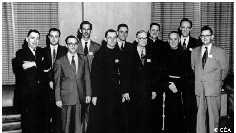
L'histoire de l'éducation des adultes est marquée par l'action d'organisations de la société civile. Par exemple, la Société canadienne d'enseignement postsecondaire (SCEP) qui est devenue l'Institut de coopération pour l'éducation des adultes (ICÉA) en 1955. L'ICÉA a été fondé en 1946. (Photo : conseil d'administration de la SCEP, en 1951)

C'est l'histoire de tous les lieux, les milieux et les domaines d'apprentissage.