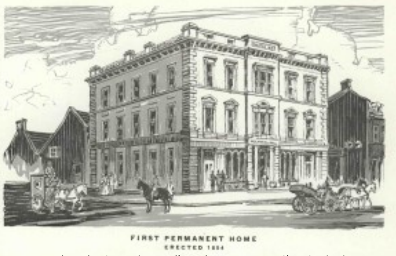
Le Montreal Mechanics Institut est l'une des toutes premières institutions d'éducation des adultes.

L'Année de l'histoire de l'éducation des adultes se terminera en septembre 2018 par la tenue d'un forum sur l'avenir de l'éducation des adultes.