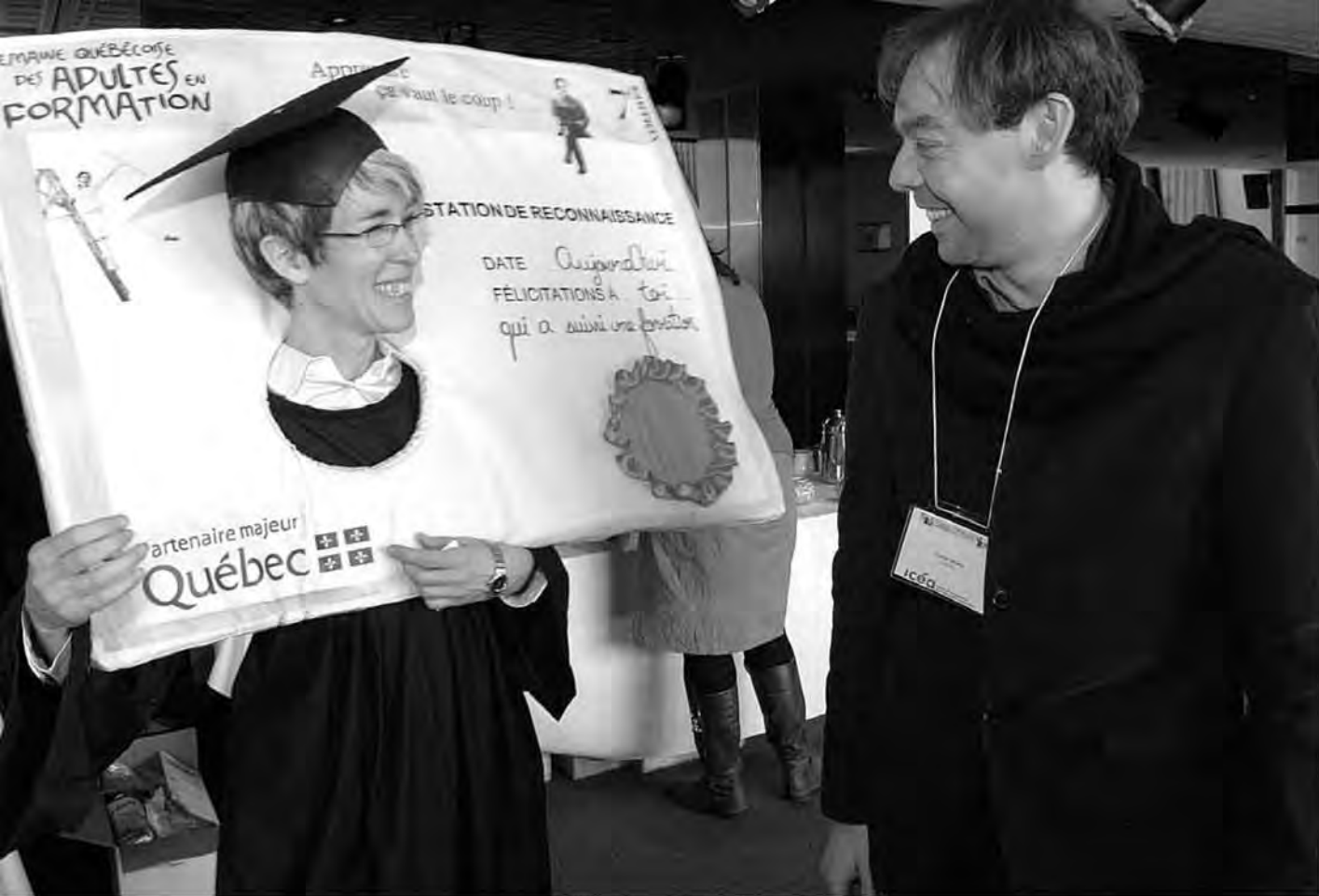
La professeure REC de la table régionale de coordination de Laval (SQAF) encourage les adultes à apprendre tout au long de la vie.