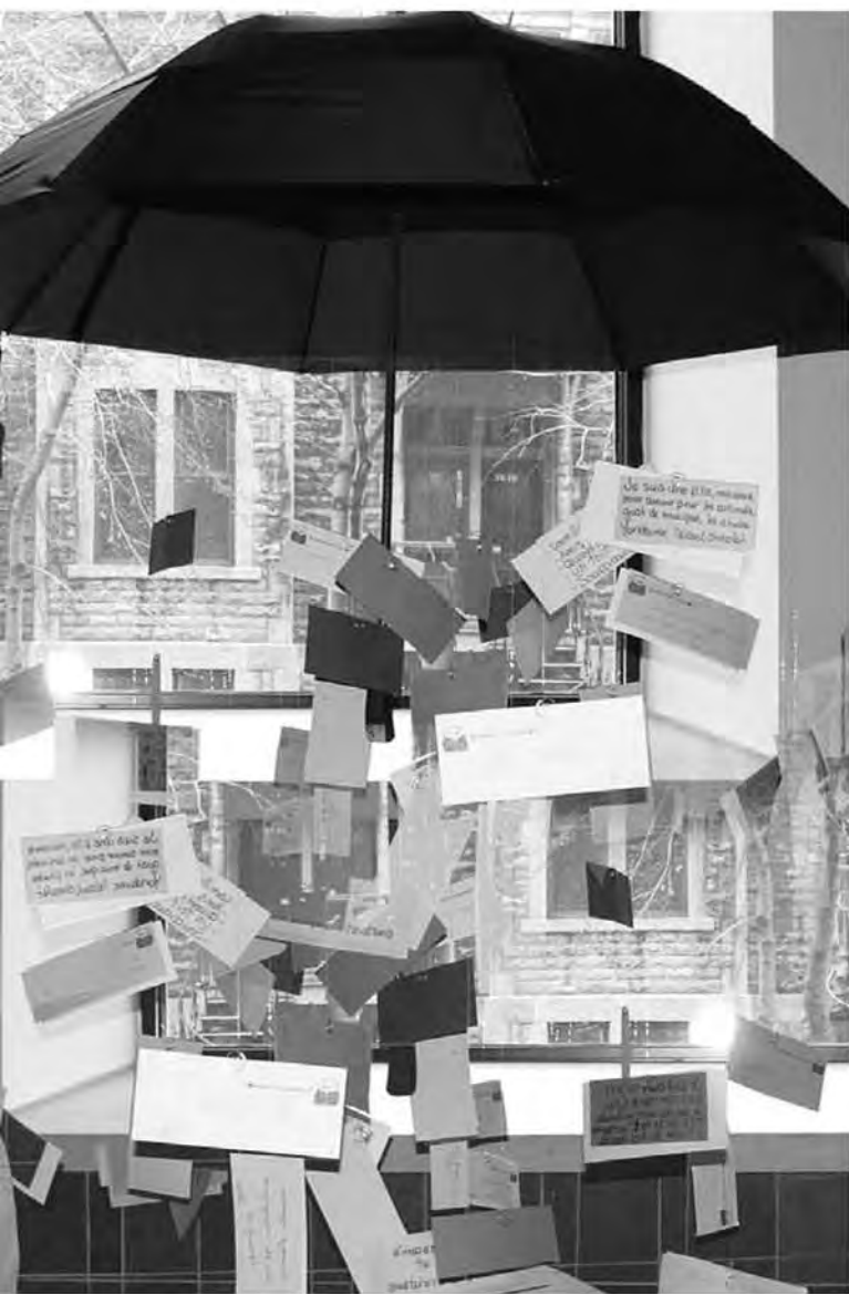
Présentation d'un totem de textes d'adultes au cours de l'activité « La Grande Lecture », activité en marge de la campagne de sensibilisation publique coordonnée par l'ICÉA dans le cadre de la Semaine d'action mondiale pour l'éducation .