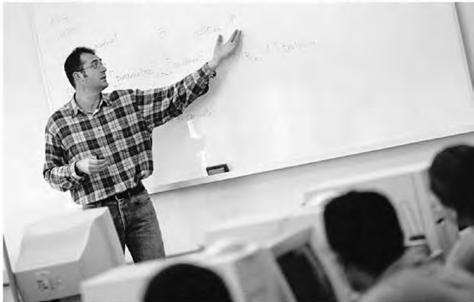
Séance de travail avec des participants aux ateliers Accès-formation.