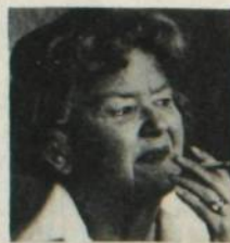
Illustration: Danielle Blouin, Sylvie Roche

* La Presse, 16 octobre 1982, entrevue de Pierre Beaulieu.